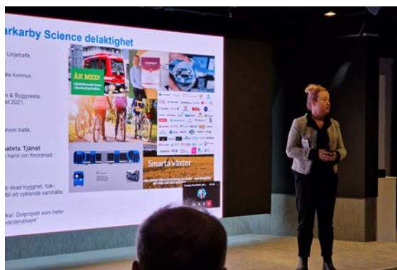
Nätverksmöte på temat Smart City den 7 april med exempel från Barkarby Science.

Höstens nätverksmöte hölls den 24 november i samband med ett studiebesök på