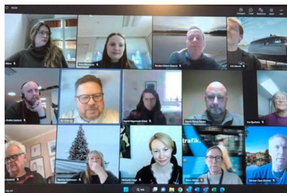
Maritima dagen 2022.

Årets arbete har framför allt riktats mot godstransporter på vatten, särskilt med bäring på arbetet med modalt skifte i Godstransportrådet. Den 14 december arrangerade Mälardalsrådet den årliga Maritima dagen med presentationer och diskussion kring aktuella frågor om vattenkvalitet,