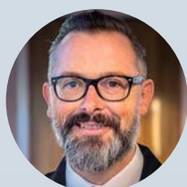
Linus Kjellberg Atrium Ljungberg