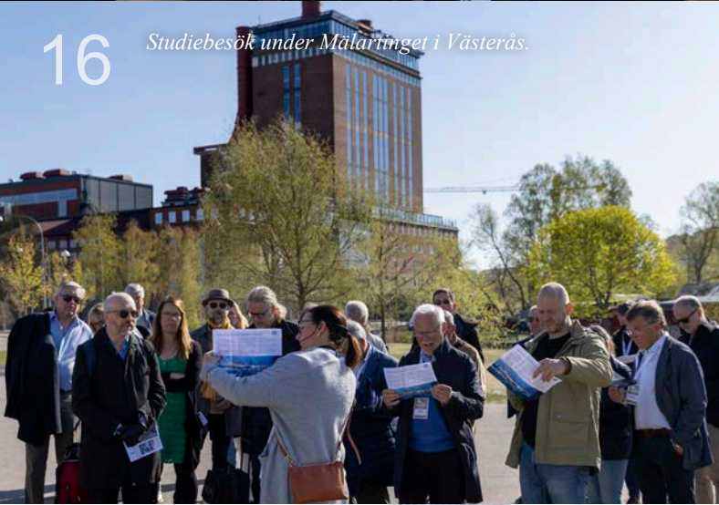
16 Studiebesök under Mälardagen i Västerås.