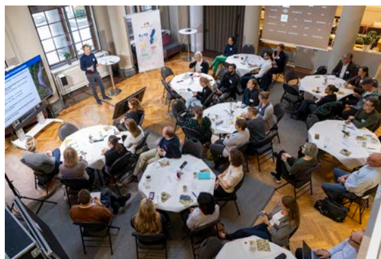
Uppstartsmöte storregionalt upphandlingsnätverk för fossilfria transporter.

Godstransportrådet har under 2022 fortsatt konkretiserat sitt arbete mot två temaområden: modalt skifte och elektrifiering. 20 maj genomförde Godstransportrådet ett studiebesök till Eskilstuna logistikpark för att se närmare på goda exempel med bäring på temaområdena. Som en del i arbetet med elektrifiering gick Mälardalsrådet in som värd med BioDriv Öst för ett utvecklat storregionalt nätverk om offentlig