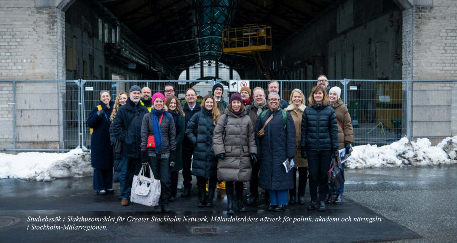
Studiebesök i Slakthusområdet för Greater Stockholm Network, Mälardalsrådets nätverk för politik, akademi och näringsliv i Stockholm-Mälardalenregionen.