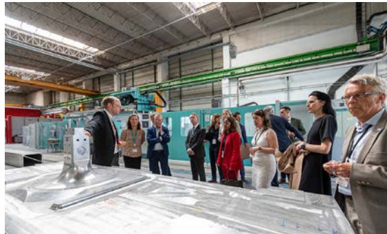
Studiebesök på Siemens Mobility i Wien.

NightJet-tågen. Gruppen provåkade även Wiens välutvecklade kollektivtrafiksystem som drivs tillsammans med grannregionerna Niederösterreich och Burgenland. Under det senaste året har en ny enhets-