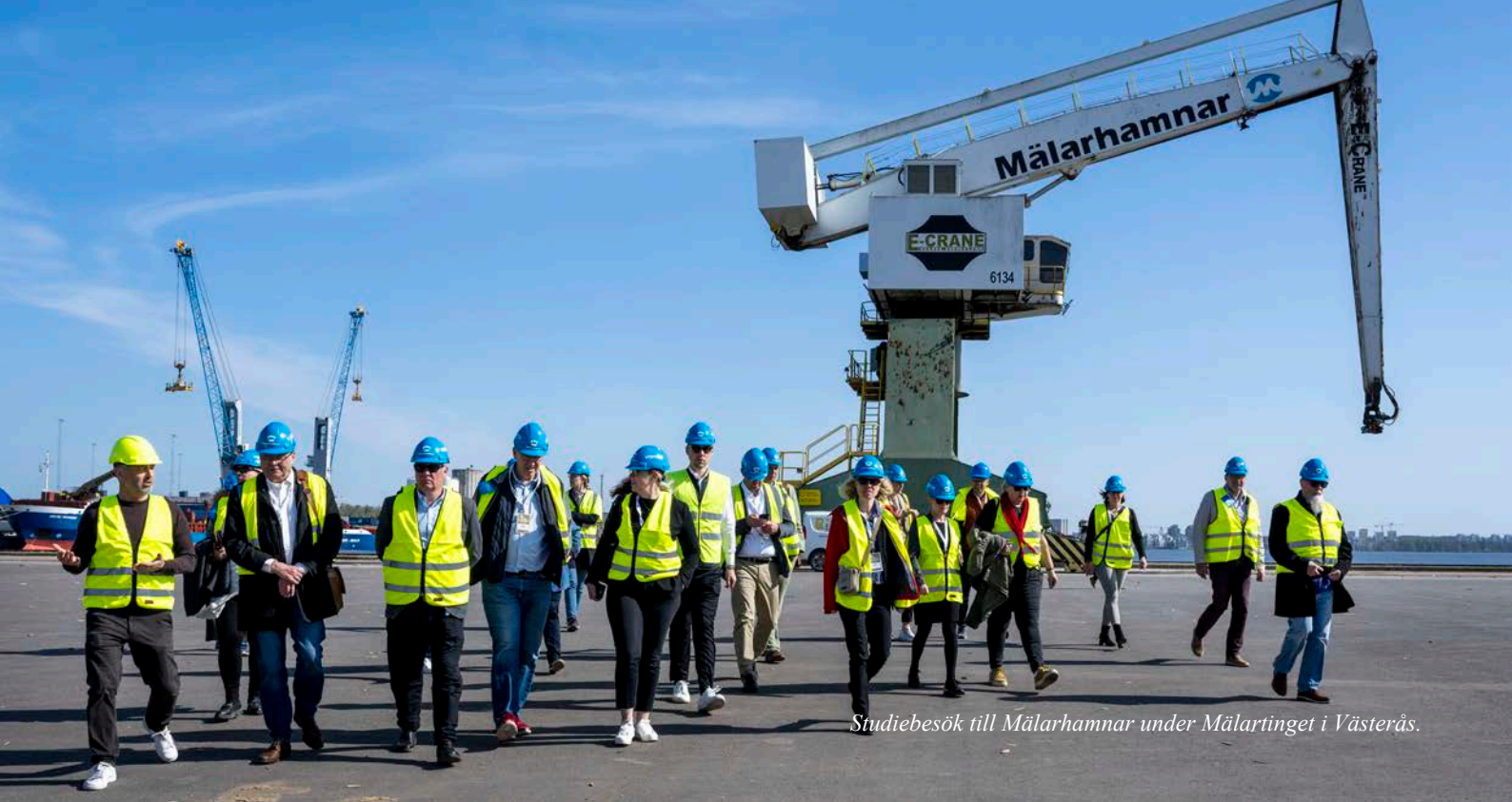
Studiebesök till Mälardalsregionen under Mälartinget i Västerås.