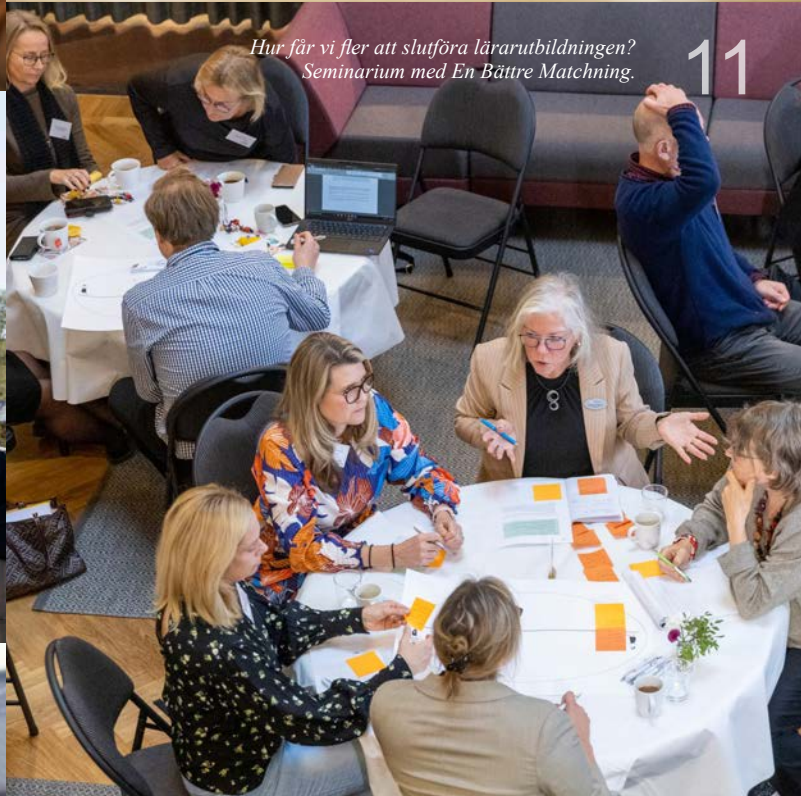
Hur får vi fler att slutföra lärarutbildningen? Seminarium med En Bättre Matching. 11