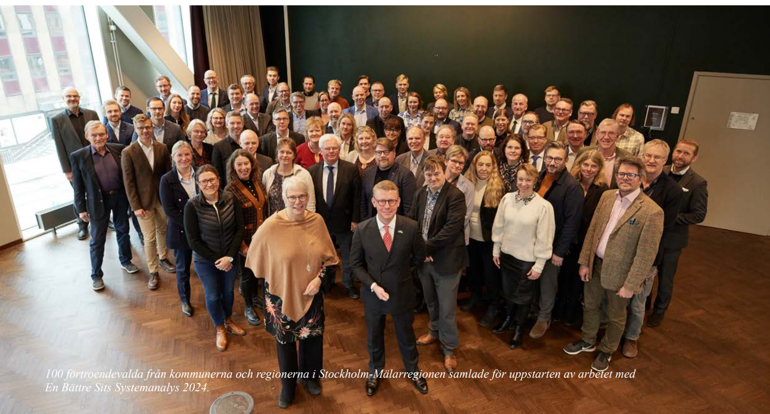
100 förtroendevalda från kommunerna och regionerna i Stockholm-Mälardalsregionen samlade för uppstarten av arbetet med En Bättre Sits Systemanalys 2024.

Höstens arbete startade med en workshop där EBS Lilla tjänstepersonsgruppen diskuterade kommande arbetsprocess. Möten hölls även i EBS Direktörsgrupp under hösten. Förslag på arbetsfokus och upplägg för kommande process bereddes med utgångspunkt i att Systemanalys 2020 står sig stark och att kommande process därmed bör innefatta en aktualitetsprövning av analysen utifrån samarbetets kärnområden: storregional kollektivtrafik, godstransporter samt internationell tillgänglighet och konkurrenskraft. Under hösten inventerades nya kunskapsunderlag utifrån aktualiseringsbehovet och behovet av nya perspektiv i arbetet. Mälardalsrådet tog exempelvis fram rapporten "Pandemins effekter – vad kvarstår?" som godkändes