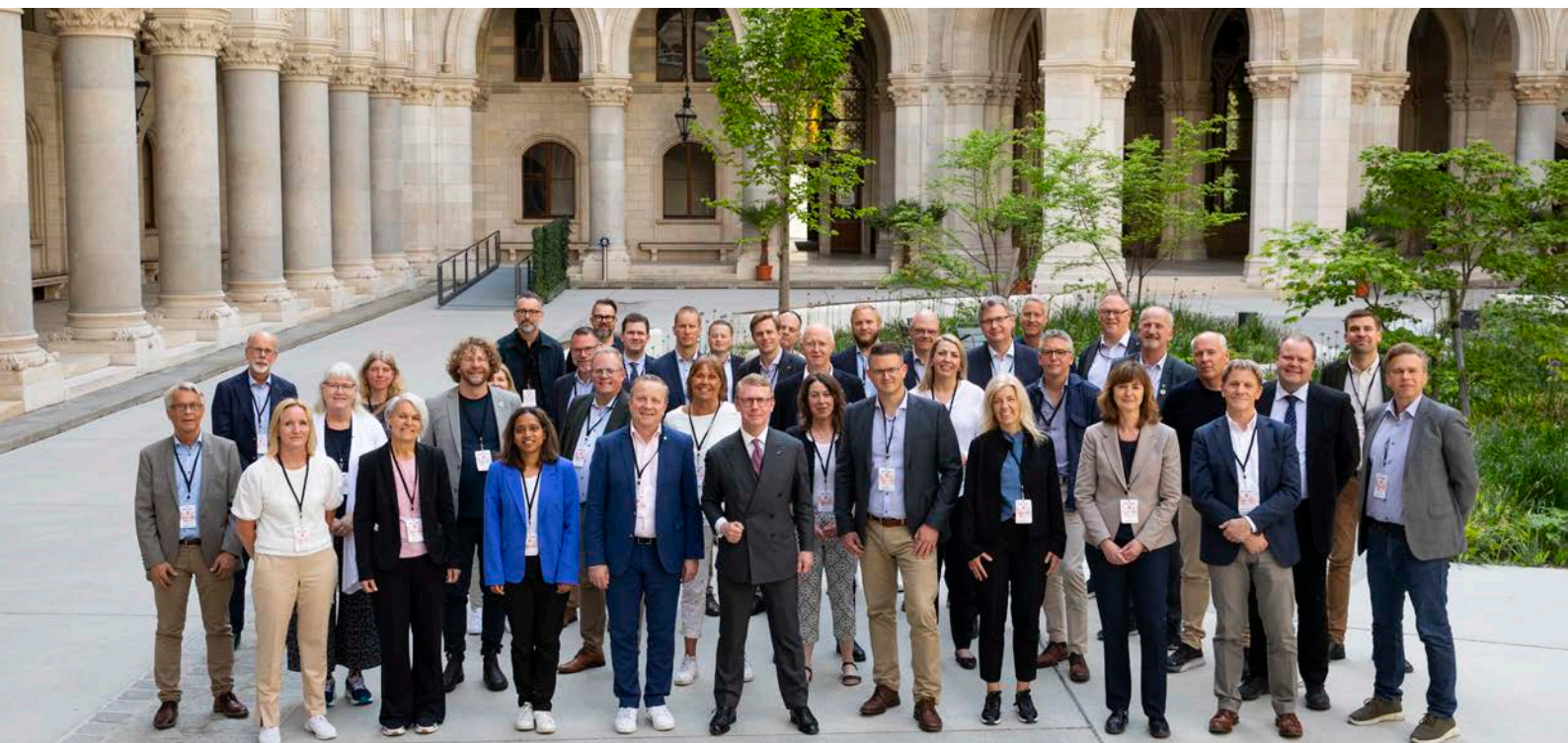
Mälardalsrådets tionde internationella studieresa gick till Wien med en bred delegation med ledande företrädare från politik, akademi och näringslivet.

Uppföljning och fortsatt arbete på hemmaplan hanteras inom ramen för Greater Stockholm Network. Bland lärdomarna finns uppföljning av Smart City samt bristen på samhällsbyggare och rekryteringen till denna sektor.