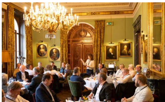
Mälardalsrådets studieresa till Wien.

Inriktningsmålet om en stark kunskapsregion inkluderar vikten av en region som främjar innovation. Mälardalsrådet har under året i den löpande verksamheten lyft fram och belyst innovativa exempel, bland annat i samband med möten i föreningens triple helix-nätverk, Greater Stockholm Network, där ett uppföljande område från studieresan till Wien handlat om Smarta städer. Olika exempel på smart och hållbar stadsutveckling har presenterats genom Stockholm Green Innovation District, Barkarby Science och Crossway Växjö.