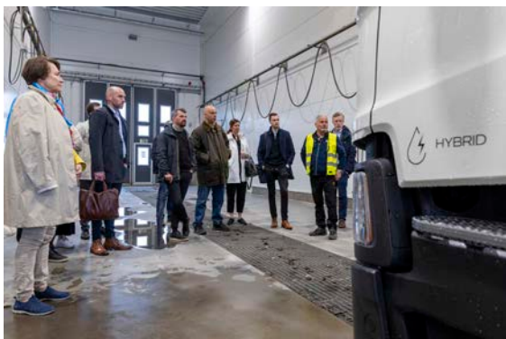
Godstransportrådets studiebesök till Eskilstuna logistikpark.

Trafikverket och Mälardalsrådets storregionala Godstransportråd samlar drygt 20 ledamöter från näringsliv, akademi och offentlig sektor för ökad hållbarhet i godstransporterna. Arbetet leds av ordförande i En Bättre Sits, med regiondirektörerna i Trafikverket Stockholm och Öst som vice ordförande. En förtroendevald representant från varje län i En Bättre Sits – nominerad av respektive region – ingår