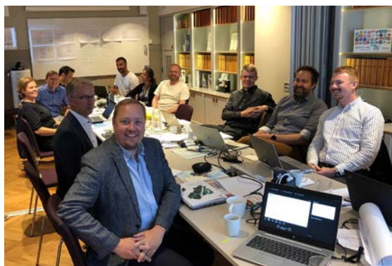
En Bättre Sits tjänstepersonsgrupp.

Under EBS Lilla och Stora Gruppens sammanträde 25 maj 2022 diskuterades inspelen från det breda uppstartsmötet 18 mars, och ytterligare medskick gjordes till processen för Systemanalys 2024. Med vårens inspel togs sedan arbetet vidare på tjänstepersonsnivå under hösten inför uppstart i en ny politisk process våren 2023.