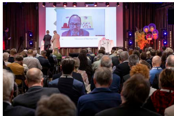
Infrastrukturminister Tomas Eneroth (S) medverkade via länk.

Mälartinget 2022 uppmärksammades i ett flertal kommunikationskanaler. Sex artiklar publicerades i redaktionell media och Mälardalsrådet nämndes åtta gånger i Sveriges radio under tidsperioden för Mälartinget. Enligt Mälardalsrådets verktyg för medianalyser nåddes potentiellt 12,2 miljoner personer. Under maj publicerades 58 inlägg om Mälartinget på sociala medier. Den totala räckvidden var 58 000 personer. Dominerande kanal bland de interagerande var Twitter.