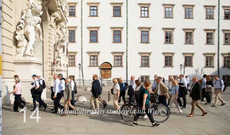
14 Mälardalsrådets studieresa till Wien.