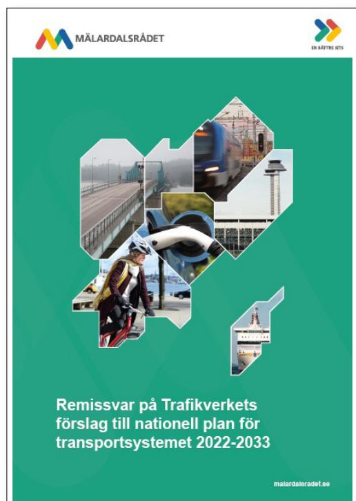
Remissvar på Trafikverkets förslag till nationell plan.

Efter att Trafikverket presenterade sitt förslag till nationell plan den 30 november 2021 hölls ett flertal möten med Trafikverkets direktörsnivå samt ledande tjänstepersoner. Mälardalsrådet deltog på regionala dialogmöten och i andra forum för att framhålla prioriteringarna i den politiskt förankrade utvecklingsstrategin för Stockholm-Mälardalenregionens transportinfrastruktur (“Systemanalys 2020”). En Bättre Sits Stora tjänstepersonsgrupp, som kallar tjänstepersoner från