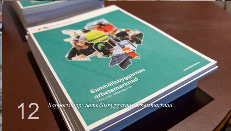
12 Rapportsläpp: Samhällsbyggarnas arbetsmarknad.