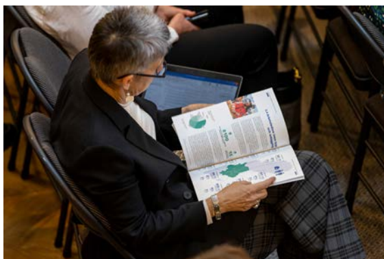
Arbetsmarknaden för samhällsbyggare har växt starkt i Stockholm-Mälardalsregionen de senaste 20 åren.

Som ett led i arbetet beslutade den politiska styrgruppen för En Bättre Matchning