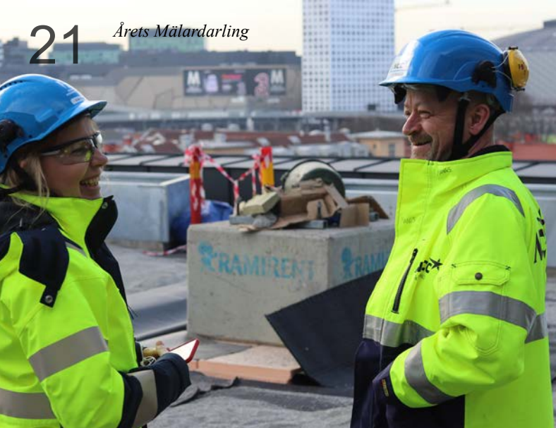
21 Årets Mälardarling