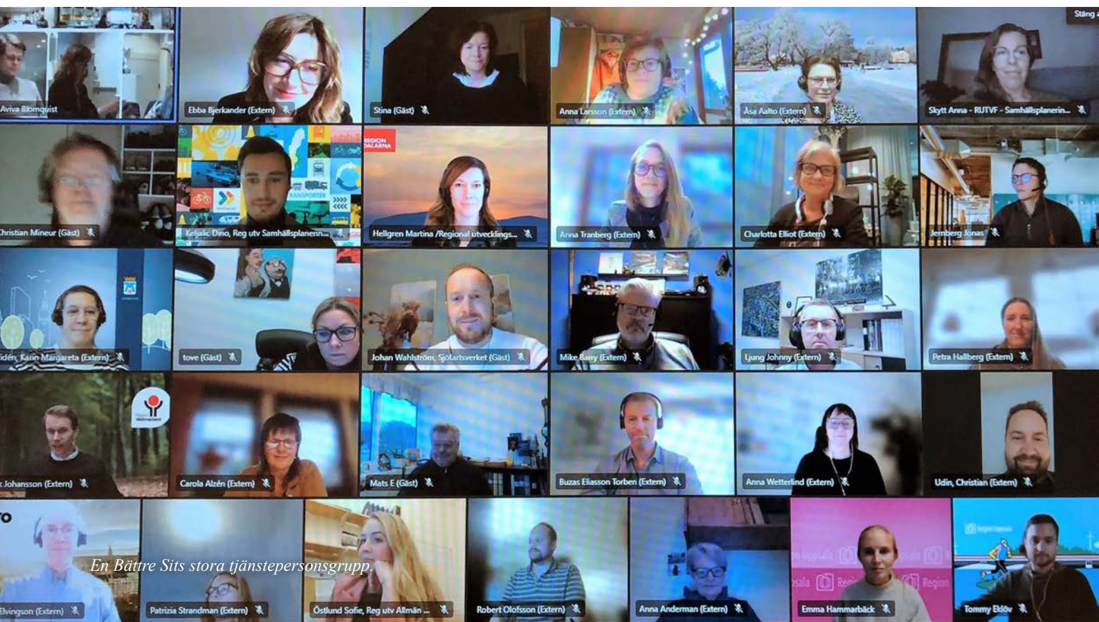
En Bättre Sits stora tjänstepersonsgrupp.

Mälardalsrådet är partner i Reglab, ett forum för lärande om regional utveckling. Mälardalsrådet deltog på Reglabs digitala årskonferens den 9–10 februari med det övergripande temat ”Omställning pågår”. Deltagandet bidrog till ökad kunskap, omvärldsbevakning samt nätverkande med medlemsorganisationer och andra aktörer som arbetar med regional utveckling.