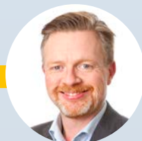
Anders Josephsson Transportföretagen