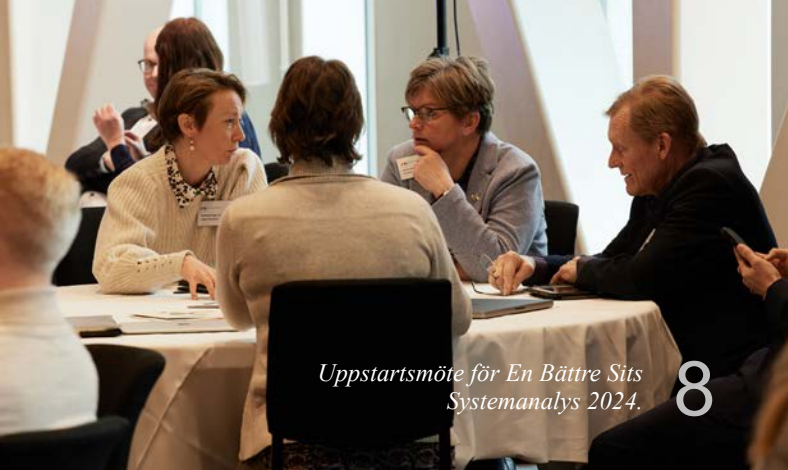
Uppstartsmöte för En Bättre Sits Systemanalys 2024. 8