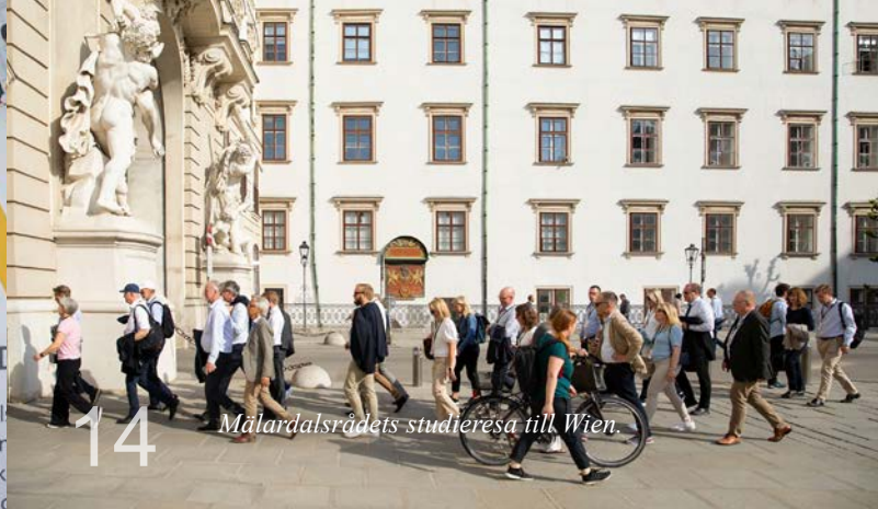
14 Mälardalsrådets studieresa till Wien.