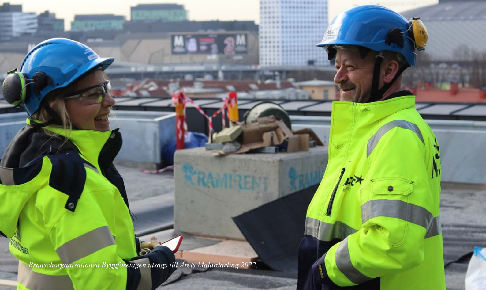
Branschorganisationen Byggföretagen utsågs till Årets Mälardarling 2022.