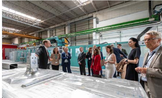
Studiebesök på Siemens Mobility i Wien.

NightJet-tågen. Gruppen provåkade även Wiens välutvecklade kollektivtrafiksystem som drivs tillsammans med grannregionerna Niederösterreich och Burgenland. Under det senaste året har en ny enhets-