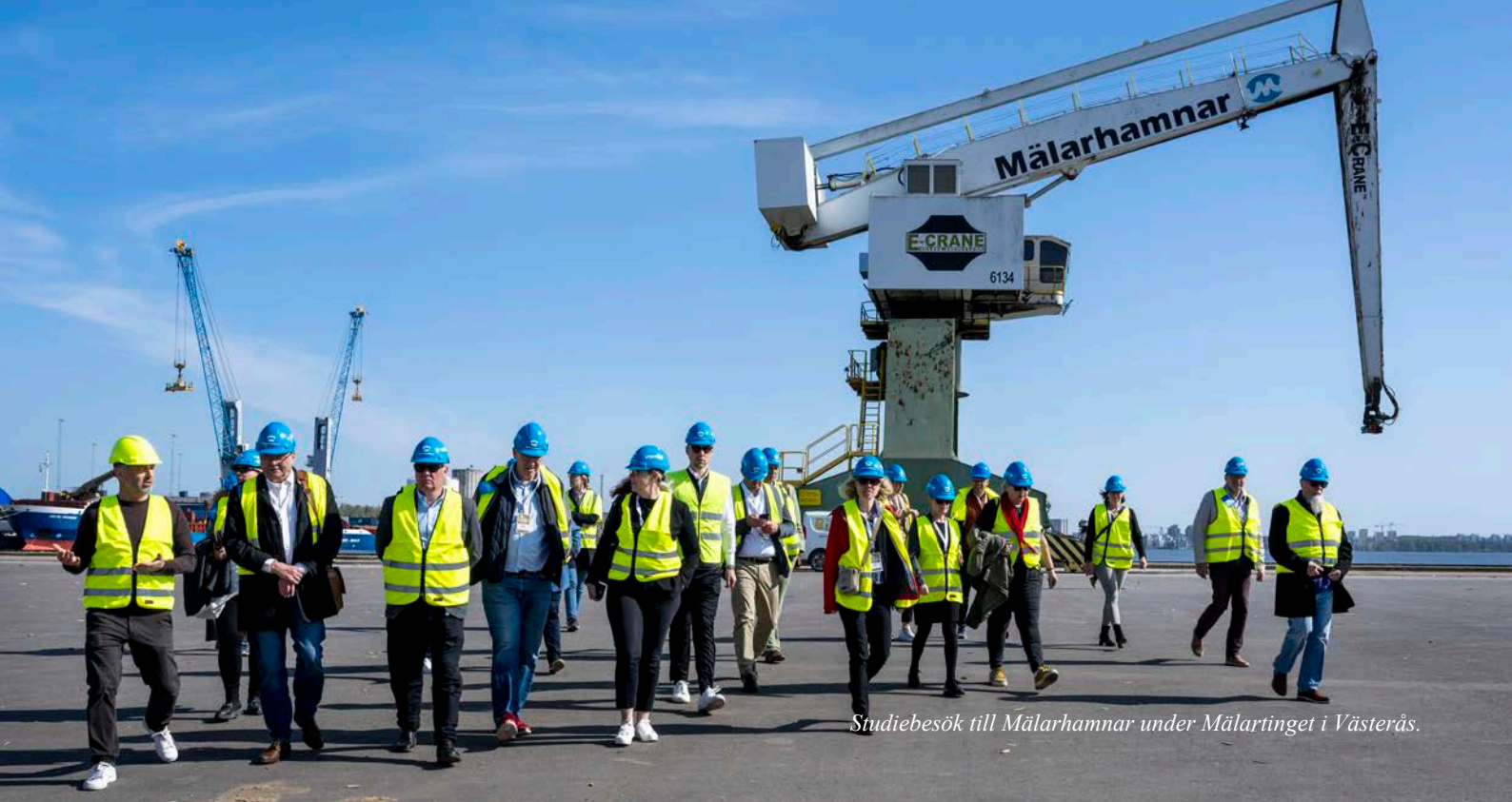
Studiebesök till Mälarderhamnar under Mälardagen i Västerås.