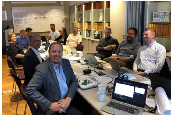
En Bättre Sits tjänstepersonsgrupp.

Under EBS Lilla och Stora Gruppens sammanträde 25 maj 2022 diskuterades inspelen från det breda uppstartsmötet 18 mars, och ytterligare medskick gjordes till processen för Systemanalys 2024. Med vårens inspel togs sedan arbetet vidare på tjänstepersonsnivå under hösten inför uppstart i en ny politisk process våren 2023.