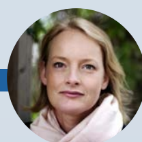
Alexandra Hagen White Arkitekter